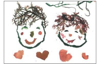
第4回海藻おしば教室の様子と作品例