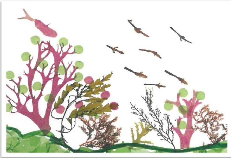
第2回海藻おしば教室参加者の作品例