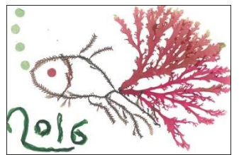
第6回海藻おしば教室の様子と作品例