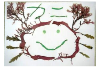
第3回海藻おしば教室の様子と作品例