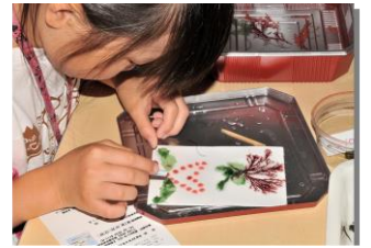
第1回、2回海藻おしば教室の様子と作品例